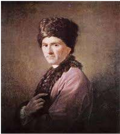
Portret van Rousseau in Armeense kledij door Allen Ramsey in 1766

Hij schreef verschillende toneelstukken en componeerde opera's. Zijn opera Le devin du village (de waarzegger van het dorp) werd in 1752 in aanwezigheid van koning Louis XV en diens maîtresse Madame de Pompadour succesvol opgevoerd in het kasteel van Fontainebleau.