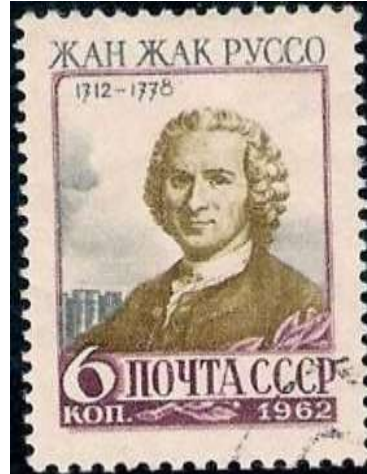
Jean-Jacques Rousseau 1712-1778

Rousseau schreef een autobiografie waarin hij als niemand te voren zijn zielenroerselen bloot legde; daarmee heeft Rousseau op menig schrijver na hem invloed uitgeoefend.